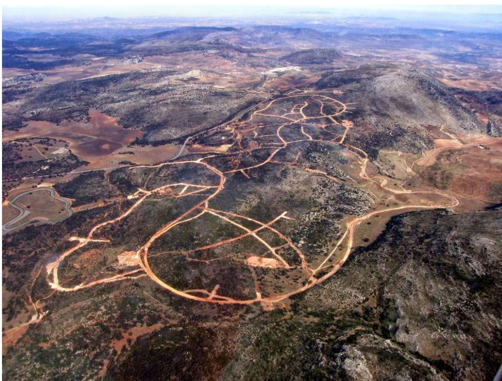
Vista aérea de algunos de los destrozos ya efectuados

HACE más de tres años escribíamos en el Observador 1 la primera parte acerca de este macroproyecto que en 2011 todavía constituía una grave amenaza. En la conclusión de nuestras pesquisas decíamos: “en 20 años: un total de 50 empresas se han acercado, especulando de una u otra forma, a Merinos Norte, (ha habido) tres compraventas, dos parones, mas de 20 denuncias falsas contra algunos opositores al proyecto, miles de encinas arrancadas, un paisaje lunar, una inmoral connivencia con los políticos, una continuada especulación, una tremenda destrucción del territorio y unos daños absurdos a las relaciones sociales..., pero al final, el “monte mete”. ¿Qué queríamos decir con esta sentencia serrana acerca del monte y su capacidad auto-regenerativa? Decíamos lo que hoy celebramos: que las resistencias se mueven y crecen, que no todo está perdido, que otras alternativas son posibles y que las contestaciones justas, honestas y autónomas pueden conseguir lo que al principio parece imposible. Por eso, solo escribimos en aquella ocasión la primera parte de esta historia, reservándonos la segunda para proclamar como la lucha va avanzando, y esperamos que la tercer parte se escriba pronto, cuando acabe la pesadilla de Merinos.