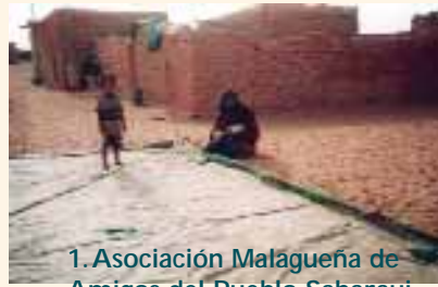
1. Asociación Malagueña de Amigos del Pueblo Saharaui