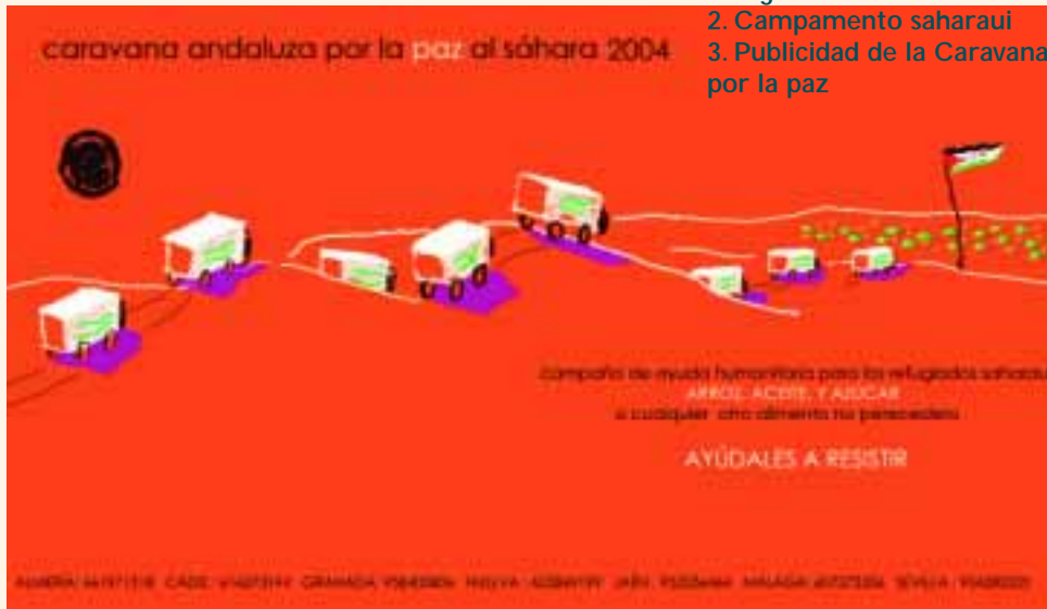
3. Publicidad de la Caravana por la paz

Siendo consciente de la grave situación que atraviesa el pueblo saharai, por la paralización del Plan de Paz de 1991 de las Naciones Unidas, y las negativas consecuencias que la posible reanudación de las hostilidades pudieran tener para toda la región del Magreb sería necesario: