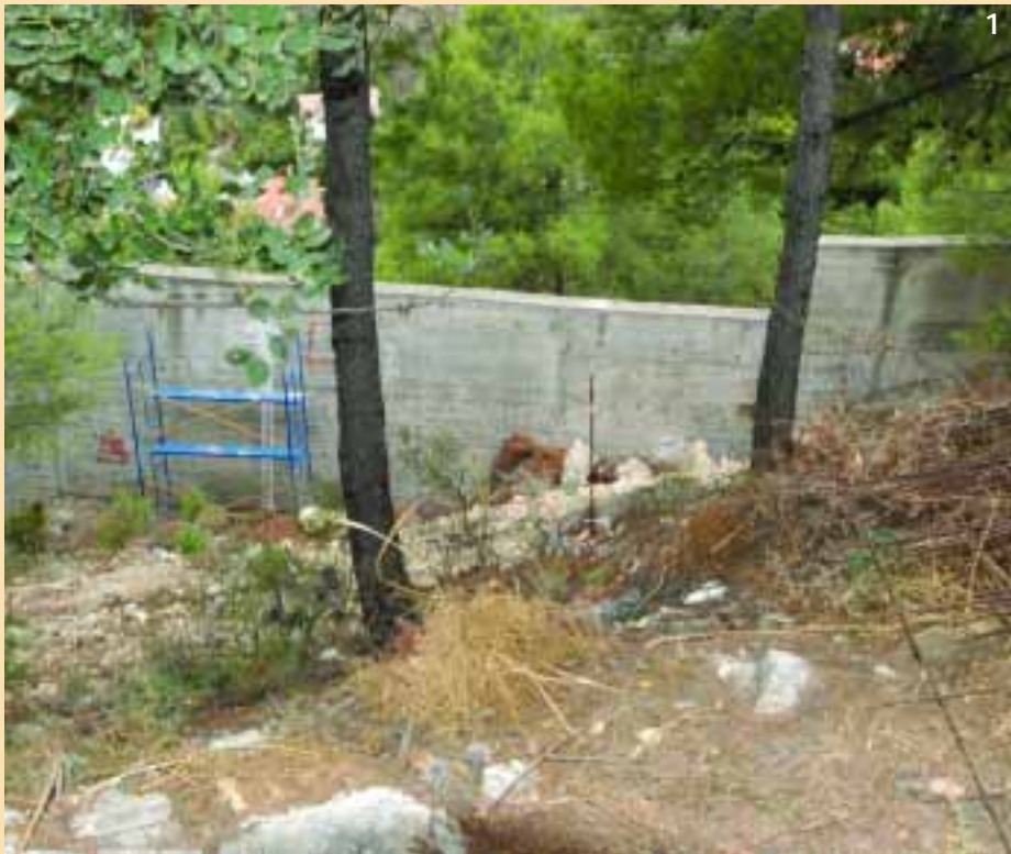
1. Muro de contención cuya demolición ordenó el Tribunal Supremo en 1999, y que Evemarina aprovechará con consentimiento municipal

A Evemarina, por su parte, se le comunicó la resolución del Supremo mediante un acta notarial, acompañada de una petición vecinal para que derribe el muro y realice