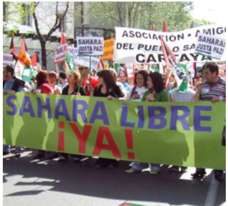
Manifestación en Madrid, 2006

10. «...Reiteramos nuestra abierta disposición a colaborar, desde el consenso y la cooperación, con los esfuerzos que el Gobierno del Estado español realice para contribuir de manera eficaz a dar una solución justa y definitiva del conflicto político del Sáhara Occidental, sobre la base de la legalidad internacional (que supone la consideración del tema saharauí como un proceso de descolonización) y el derecho inalienable del Pueblo Saharaui a poder elegir libremente su futuro...».