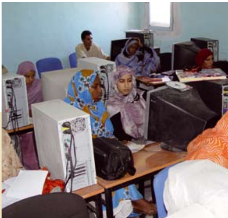
Proyecto Zagharit; Centro de informática

Acciones solidarias que hacen posible la creación y consolidación de las infraestructuras y servicios públicos de la RASD, apoyo y capacitación de las organizaciones sectoriales saharauis (Unión Nacional de Mujeres Saharaui, Unión de la Juventud Saharaui, Unión General de Traba-