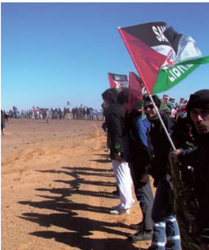
Arriba. Manifestación en Madrid, 2007 Centro. Manifestación en Sevilla, julio 2005 Abajo. La Columna de los Mil frente al muro marroquí