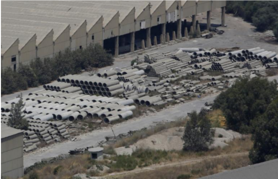
Fábrica abandonada en el distrito de Koura al norte del Líbano, en la actualidad