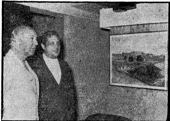
Con la exposición que acaba de inaugurar en la galería de arte de El Remo y que estará abierta hasta el próximo día 21 el pintor murciano Pedro Avellaneda, se reanuda el ciclo de manifestaciones pictóricas que,

bajo patrocinio del Club Soffico, se han venido celebrando en los distintos edificios que la empresa tiene a lo largo de la Costa. La obra de Avellaneda constituye una muestra del actual movimiento pictórico murciano, estando considerado el artista como su genuino representante y maestro en la utilización de los ocre, color predominante de las tierras levantinas. En el acto de inauguración de la muestra de Avellaneda, fue servida una copa de vino español a los asistentes. En la foto, el pintor posa con el teniente general Cavanillas, vicepresidente de Soffico, ante uno de sus cuadros más representativos.