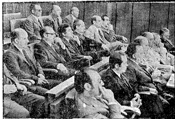
Aspecto de la sala

Por esta razón, dijo, los medios de acción con los que hemos de contar han de constituir la base de todo planteamiento. Porque del perfeccionamiento de las estructuras, de la capacidad del dispositivo, de la cobertura de nuestra acción, depende en gran medida que el hombre no se frustre políticamente. Y