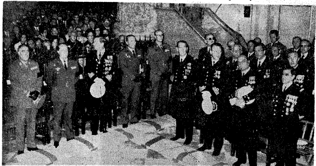
Presidencia militar y nutrida representación de jefes y oficiales de la Marina de guerra española

Acabada la misa y la oración fúnebre, el gobernador civil y primeras autoridades provinciales se situaron ante la Cruz de los Caídos del patio de las Cadenas de la S. I. C. A medida que los asistentes salían del templo, y en respetuosa actitud, reiteraron su sincero pésame a las autoridades malagueñas. El acto se prolongó durante largo rato. Finalmente, y de forma espontánea, los asistentes entonaron el «Cara al Sol», dando los gritos de ritual el señor Hernández Sánchez, dándose con esto por finalizado el acto.