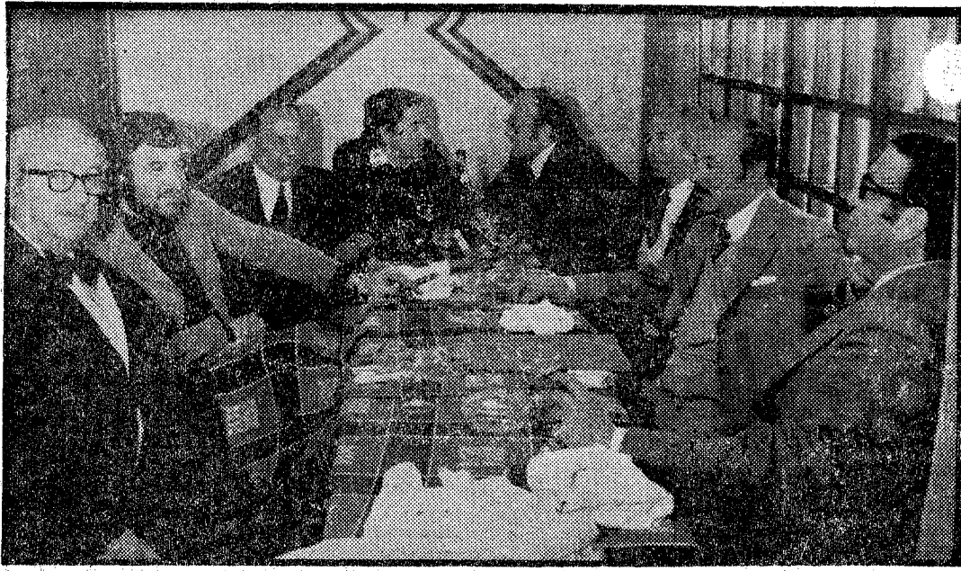
Un momento de la reunión del jurado del premio de cuentos «Estebanez Calderón», ayer en Antonio Martín.