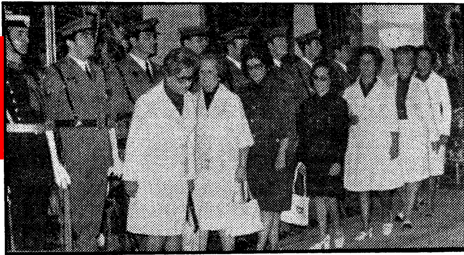
Sección Femenina del Movimiento.

enviaron telegramas de adhesión a la Casa Civil del Jefe del Estado, al vicepresidente primero del Gobierno y ministro de la Gobernación, y al ministro Secretario General del Movimiento.